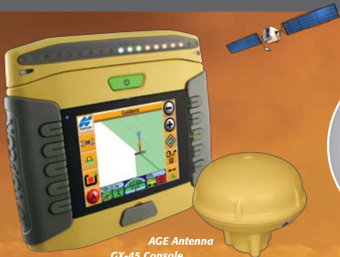
AGE Antenna GX-45 Console

controllo della direzione di avanzamento mentre lo schermo fornisce tutte le informazioni per una guida precisa ed accurata. La consolle è leggera e facile da installare permettendo così l'utilizzo del sistema su più trattori.